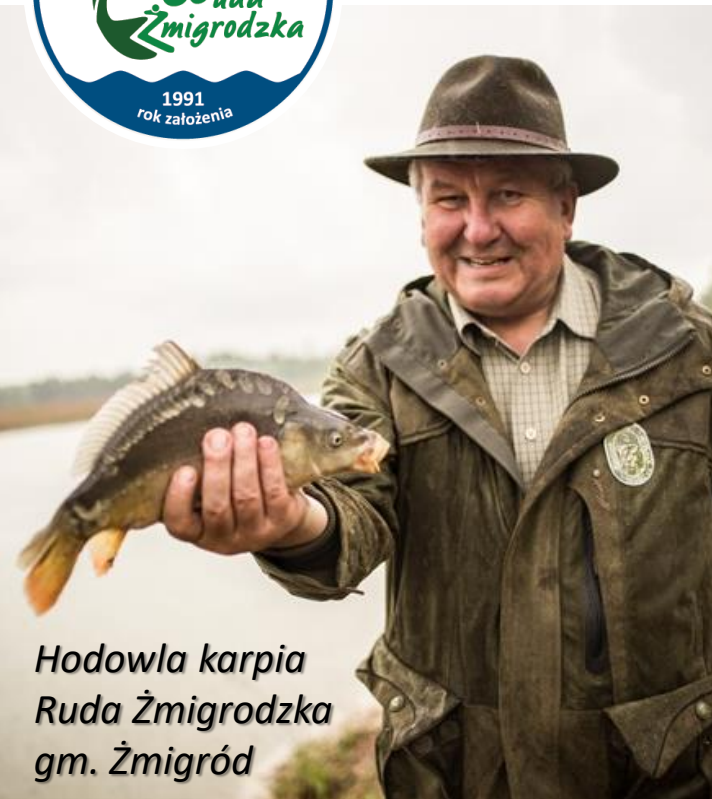
Hodowla karpia Ruda Żmigrodzka gm. Żmigród